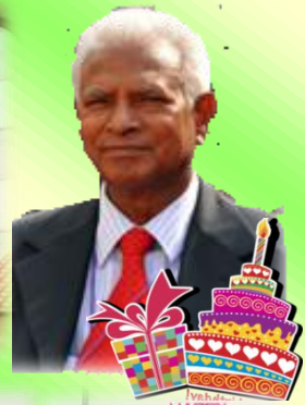
Founder's Day assembly